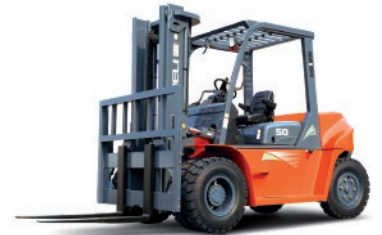
Serie G 5 - 10 TON.