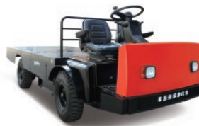
Serie G 1.0-5.0 TON.