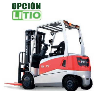
Serie G3 4 RUEDAS 2.5 -3.5 TON.