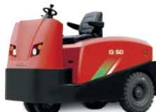
Serie G 1.5-6.0 TON.