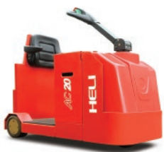
Serie G 2.0-4.5 TON.