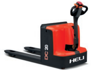
CBD20J - H 2 TON.