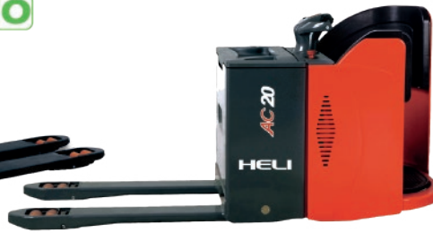
CBD20-490 2 TON. Plataforma fija - HASTA 11 Km/h.