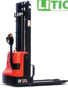
CDD12J / JD 1.2 TON. MONOMÁSTIL /MÁSTIL SIMPLEX DUPLEX/ DUPLEX G.E.L.