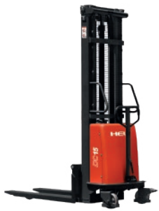
CBS10-20J 1.0 -2.0 TON ELECTROMANUAL