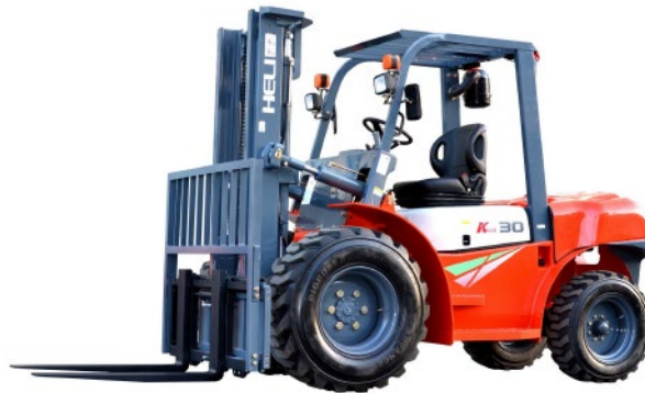
Serie K 2 - 3.5 TON (4 x 2)