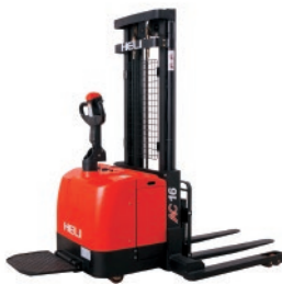
CDD14/16-D920/960/360 1.4 / 1.6 TON MÁSTIL DUPLEX / TRIPLEX Dirección eléctrica