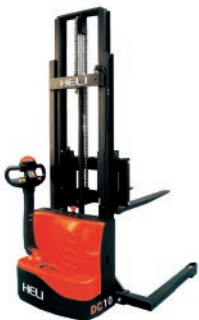
CDD10-050 1 TON. MÁSTIL SIMPLEX / DUPLEX