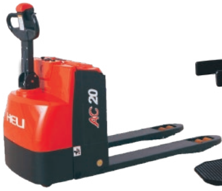
CBD18/20-150 2 TON Dirección eléctrica