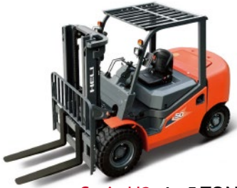
Serie H3 4 - 5 TON.