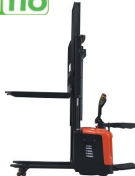
CDD15J / 20J 1.5 - 2.0 TON MÁSTIL DUPLEX