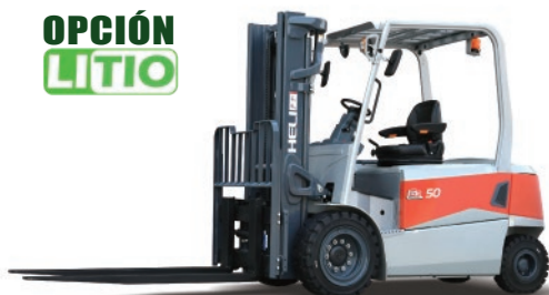
Serie G3 4 RUEDAS 4 -5 TON. 80V