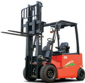
Serie G 4 Ruedas 1 -2.5 TON. 48V