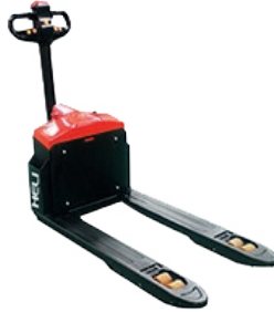
CBD15-170J/G 1.5 TON.