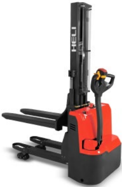
CDD12RD-S 1.2 TON MÁSTIL SIMPLEX