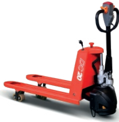
Semi eléctrica CBD20J-B 2 TON.