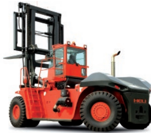
Serie G 14 - 46 TON.