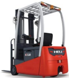
3 Ruedas 0.8-1.2 TON. 24V