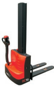
CDD10-080 1 TON. MÁSTIL SIMPLEX