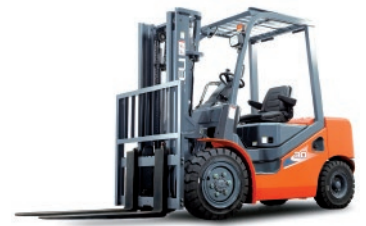
Serie H3 1.5 - 3.5 TON.