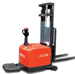
CDD06-970 Contrapesado - 0.6 TON. MÁSTIL DUPLEX Dirección eléctrica