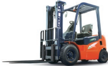
Serie G 2 - 3.5 TON.