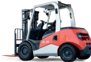
Serie G3 4 - 5 TON.