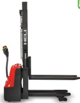
CDD12R-S 1.2 TON MÁSTIL DUPLEX