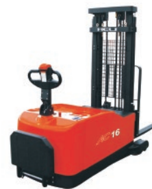
CDD12/16-D970 Contrapesado - 1.2-1.6 TON. MÁSTIL DUPLEX-TRIPLEX Dirección eléctrica