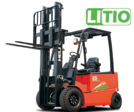
Serie G 4 RUEDAS 1 - 3.5 TON. 80V