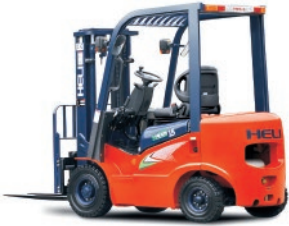
Serie G 1 - 1.8 TON.