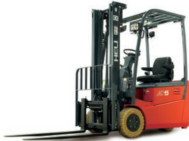
Serie G 3 Ruedas 1.25-1.5 TON. 24V