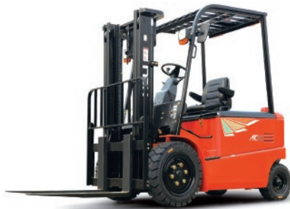
Serie G 4 Ruedas 3 -3.5 TON. 80V