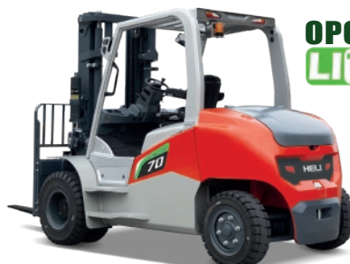
Serie G 4 RUEDAS 6 -7 TON. 80V