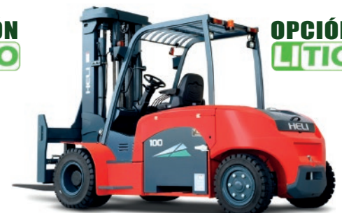
Serie G 8.5-10 TON.