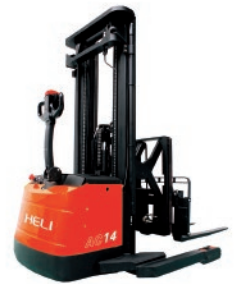
CQDH13/14-850 MÁSTIL RETRÁCTIL O PANTÓGRADO 1.2 / 1.5 TON Dirección eléctrica