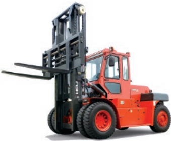
Serie G 12 - 13.5 TON.