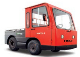
Serie G 8.0-25 TON.