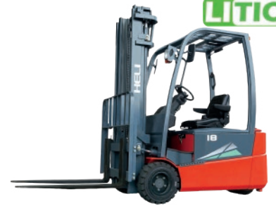
Serie G 3 Ruedas 1.5 - 2 TON. 48V