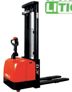
CDD12/14-030 1.2 - 1.4 TON MÁSTIL DUPLEX Dirección eléctrica