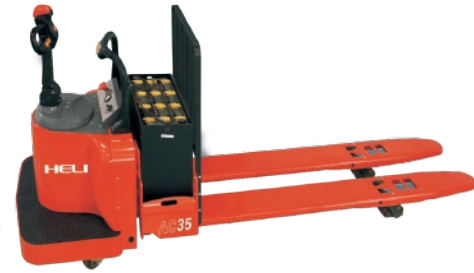
CBD35-510 3.5 TON.