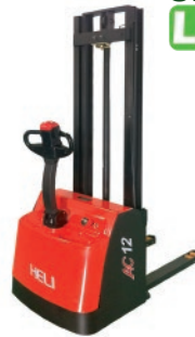
CDD12-060 1.2 TON MÁSTIL DUPLEX